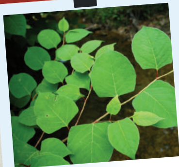
Feuilles : Triangulaires, à bout effilé, d'une longueur de 7 à 20 cm.