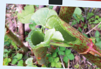
Tige : Ronde, lisse, dressée et creuse, ressemble à un bambou, facilement cassante et pourvue de taches et de nœuds rouges, d'une hauteur pouvant atteindre 3 m.