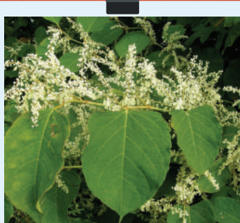
Fleurs : Grappes de petites fleurs de 2 à 4 cm, couleur blanc crème.